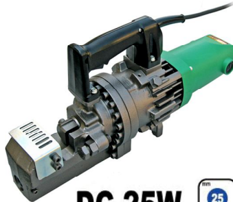
DC-25W 25 22 □

●32mmの太物鉄筋もスパッと切断。標準刃にてSD390の切断に対応。●安心の二重絶縁です。接地（アース）せずに使用できます。●特別設計されたハイパワーモーターを搭載しています。