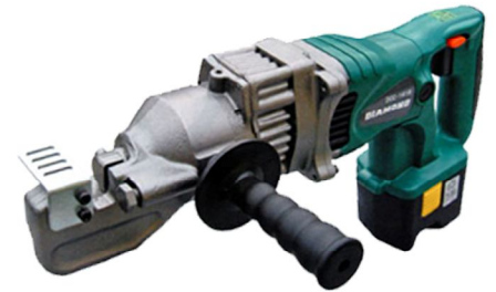
DCC-1618 16 8 □

●18V、3.0Ahの大容量バッテリー採用で、D16鉄筋も楽々切断。ヘッド部345度回転のコードレスカッター。 ●1チャージ最大切断本数は、D13 鉄筋約 140 本 D16 鉄筋約 100 本を実現しました。