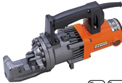
DC-20HL 20 11 □

●標準刃でSD390・D19(20mm)までの鉄筋が切断可能で耐久性に優れたモデルです。●オプションのPC鋼用カッターブロックを使用すればSD490鉄筋の切断も可能です。