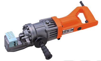
DC-20W 20 10 □

●25mmの太物鉄筋もスパッと切断。標準刃にてSD390の切断に対応。●安心の二重絶縁です。接地（アース）せずに使用できます。