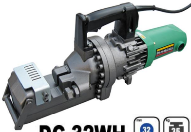
DC-32WH 32 35 □

●32mmの太物鉄筋もスパッと切断。標準刃にてSD390の切断に対応。●安心の二重絶縁です。接地（アース）せずに使用できます。●特別設計されたハイパワーモーターを搭載しています。