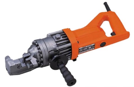
DC-16W 16 8 □

●軽量、コンパクトながら22mmまで切断できる 鉄筋カッター DC-22HL（クレジット・代引不可商品）。