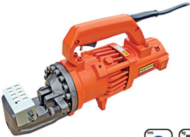
DC-20WH 20 11 □

●最大切断径20mm。D13鉄筋までなら同時切断も可能なユーティリティープレーヤー。●安心の二重絶縁です。接地（アース）せずに使用できます。